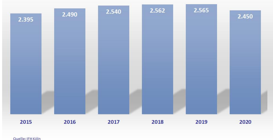
Ausgaben für Baby- und Kinderausstattung in Deutschland in den ersten 3 Lebensjahren in Mrd. Euro

Bemerkenswert: Nach einer leichten „Baby-Flaute“ im Jahr 2020 (-0,6 % im Vergleich zum Vorjahr) entpuppt sich Corona als wahrer Storch und sorgt für einen Blitz-Babyboom im März 2021. Laut vorläufigen Angaben des Statistischen Bundesamtes kamen im März 2021 65.903 Kinder zur Welt - satte 10 % mehr als im Vorjahr . So viele Geburten gab es zuletzt im März 1998. Zeitlich hängt die Entstehung der März-Babys mit dem Abflachen der ersten Corona-Welle ab Mai 2020 zusammen.